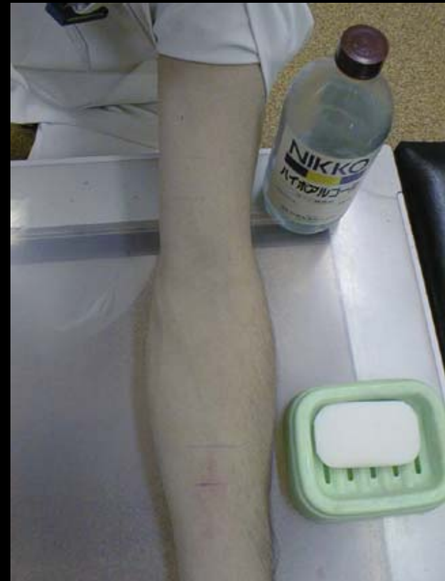
直後洗淨(上腕:ハイポ 前腕:石鹸)